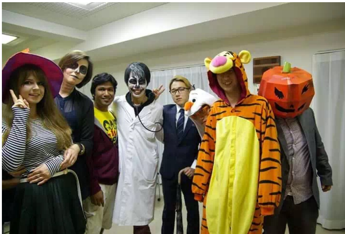
（万圣节时的“妖魔鬼怪”）

山口大学每周五晚上都会有一个交流聚会。由日本学生志愿者来确定每次的主题，这种主题派对对于我们了解日本的风俗文化有很大的帮助。