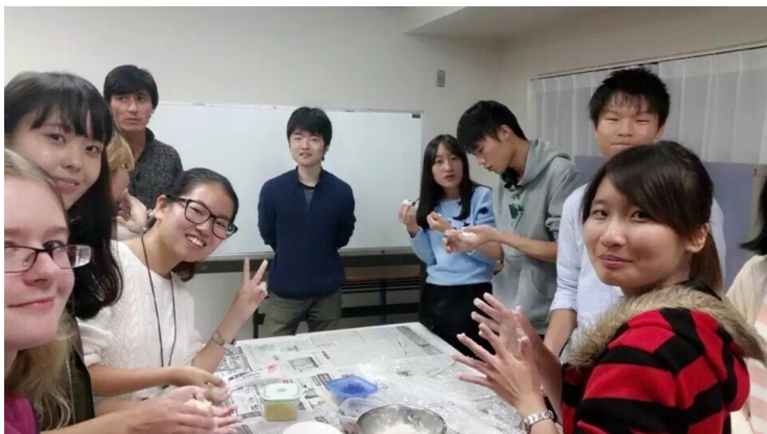
一起做大福（日本甜点）