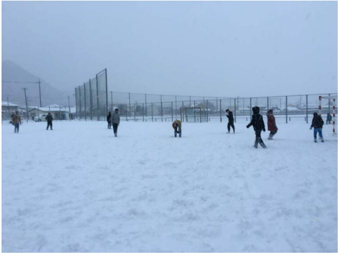
校园里随处可见造型各异的雪人，展示着日本人独特的创造力。