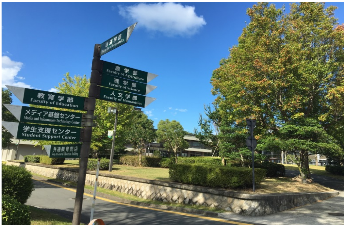
(山口大学的校园图)

安静的山口大学很适合学习，课余活动也丰富多彩。一年的留学生活就好像是一场梦，有惊喜、有感动也有遗憾，但这便是成长的意义。以下是我和山口美丽的邂逅。