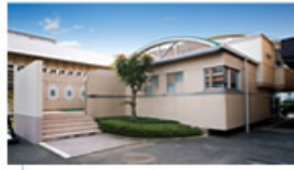
レディースルーム 15