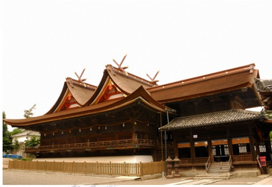
吉備津神社（きびつじんじゃ）