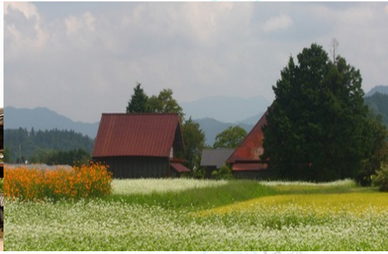
蒜山高原（ひるぜんこうげん）