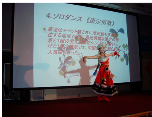
孔子学院举办文化艺术团巡演