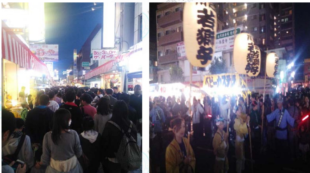
图为 10 月川越祭