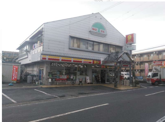
(图为东松山校区附近商场)