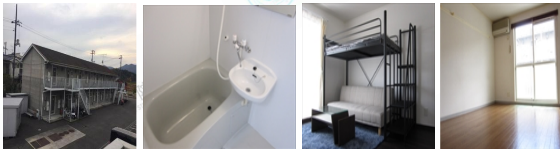
（图为 s 档寝室图片）

http://www.sumumu.com/user/hiroshima_univ.pro/index.html?from=singlemessage&isappinstalled=0 ）