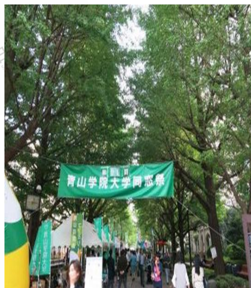
青山学院大学同学会