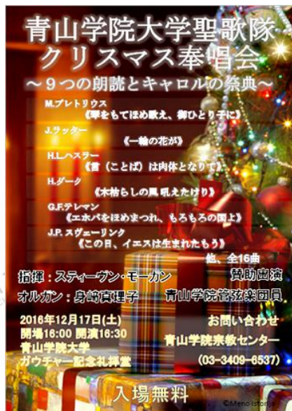
青山学院大学圣诞歌会