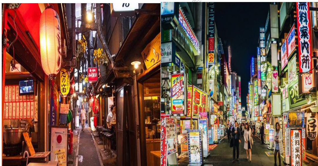
↑ 表参道是东京的特色街