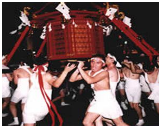
山口祇园祭祀 (7月20日-27日)