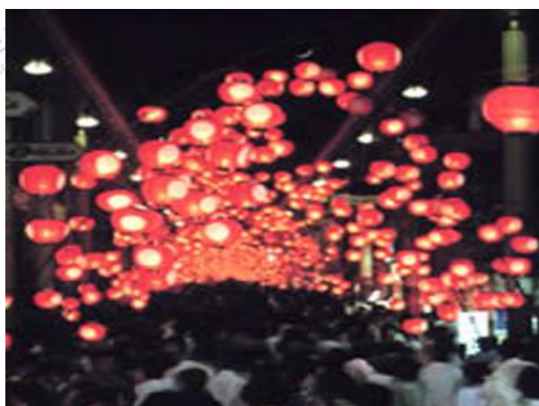
山口七夕灯笼祭 (8月6日-7日)