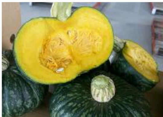
くりまさる：阿知须特产南瓜